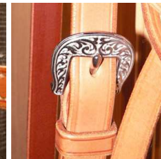
bcl. western gravée inox