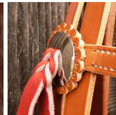
concho lisse fendu