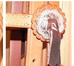
concho gravé fendu, inox