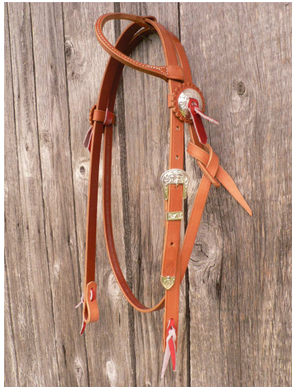
Modèle simple une oreille

Pré-Petitjean 67 CH - 2362 Montfaucon Suisse Tel : +41(0)32 955 15 15 Fax : +41(0)32 955 10 37 E-mail : info@selleriehess.ch Web : www.selleriehess.ch