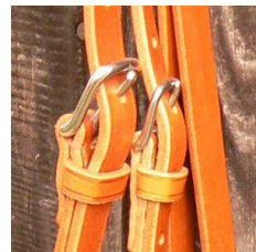
bcl. de harnais