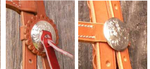
concho fendu argent ciselé